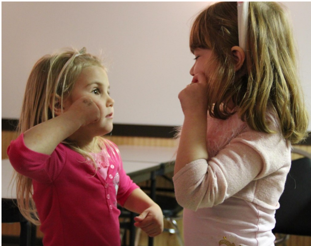
Meisjes leren elkaar gebarentaal aan.